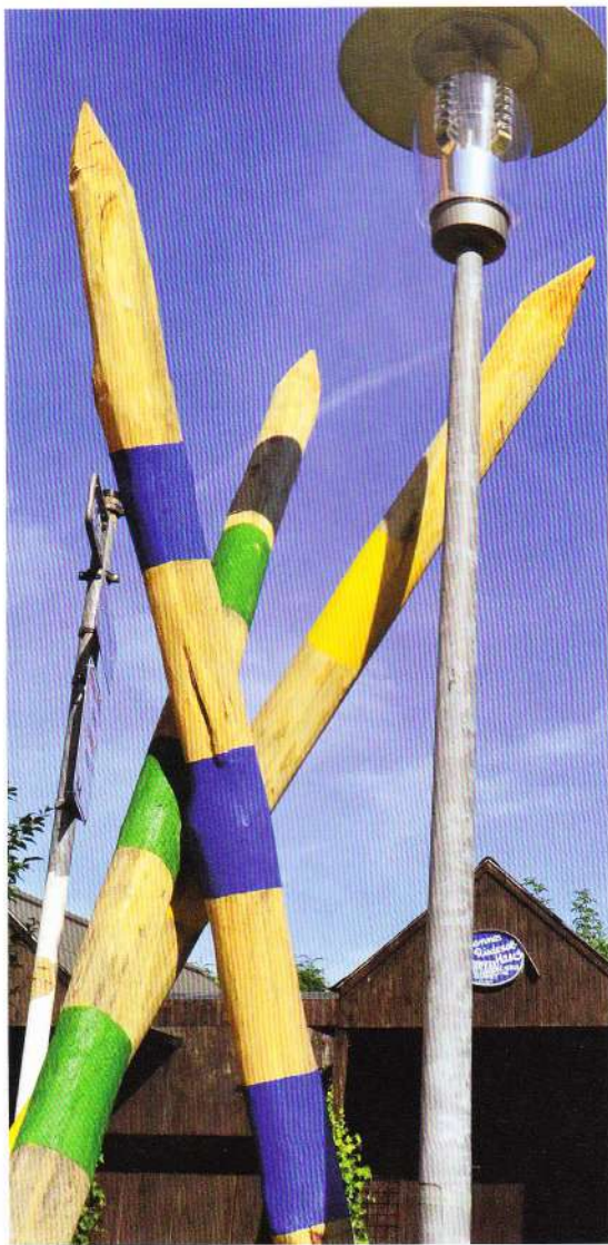
Überdimensionale Mikadostäbe weisen den Bewohnern den Weg in den Garten.

Gartenanlage von ihren Wohnungen aus gut zu erreichen („Walkability“). Die für das Konzept entwickelte Grünanlage bietet ihnen und den anderen Bewohnern Ruhe- und Rückzugsräume mit speziellem Mobiliar – wie einer mit Gras bewachsenen Gartenbank, die über eine integrierte Reizstimulation verfügt.