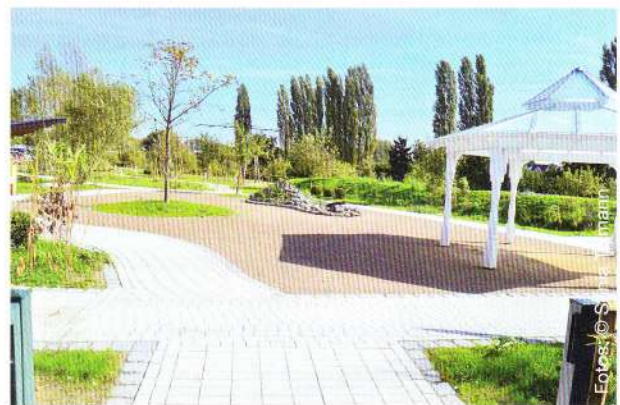
Die Gartenanlage im Fliedner-Dorf erlaubt es allen Bewohnern, am Quartiersleben teilzunehmen.