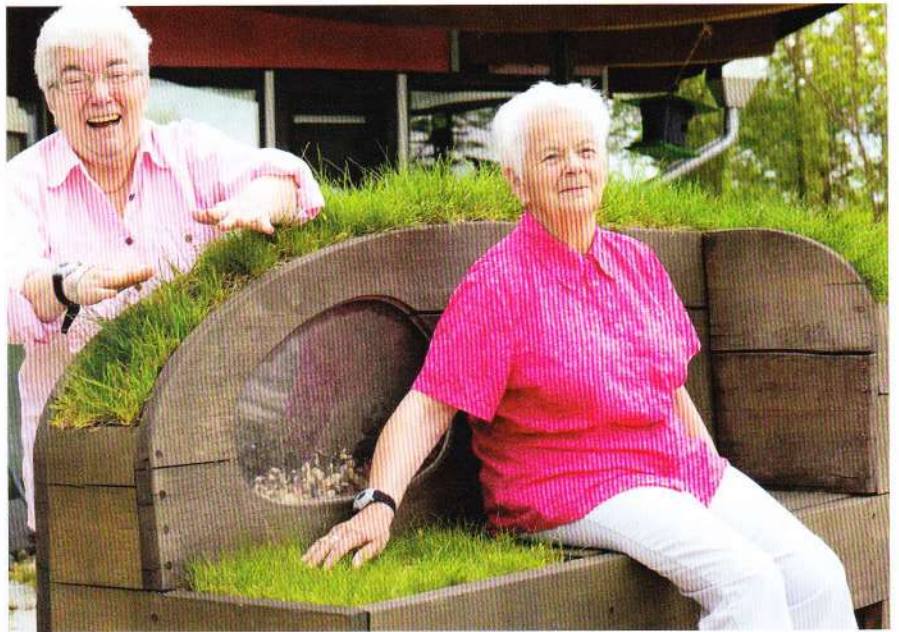
Eine mit Gras bewachsene Gartenbank: Hier lässt es sich gut ausruhen.

Die vor Ort tätigen Pflegefachkräfte, Demenztherapeuten und Angehörigen absolvierten ein Freiraum-Schulungsprogramm zur Nutzung des Gartens. 55 Mitarbeitende des Dorfes und des Sozialen Dienstes sowie Angehörige und Ehrenamtliche haben sich aktiv am Projekt beteiligt.